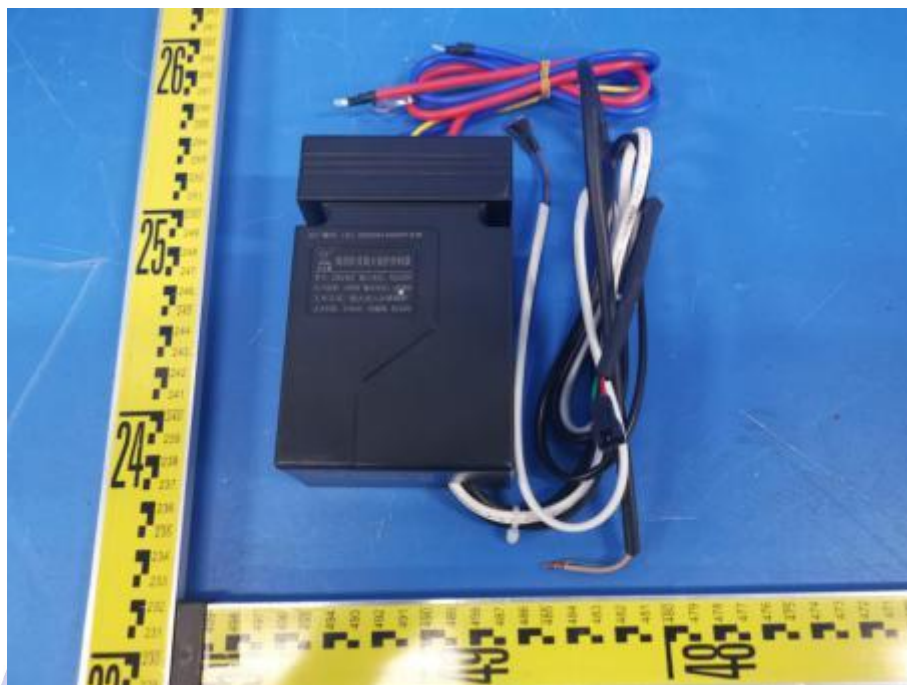
外观照片（控制器型号：DBJ-BZ, 点火器型号：DBD-A）