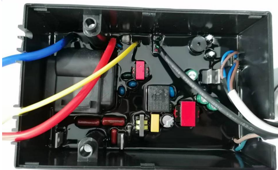
内部结构（控制器型号：DBJ-BZ, 点火器型号：DBD-A）