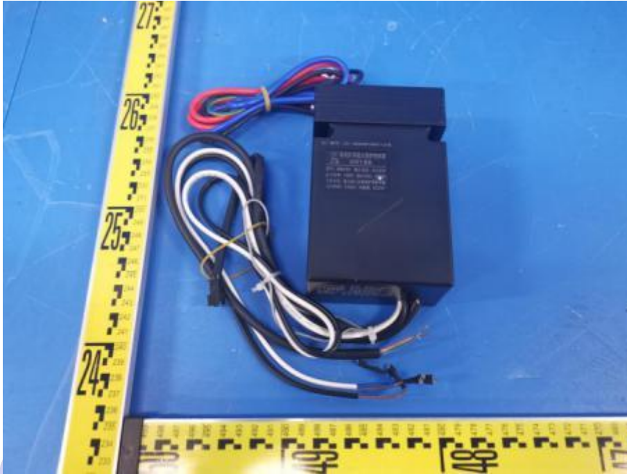
外观照片外观照片（控制器型号：DBD-B2, 点火器型号：DBD-A）