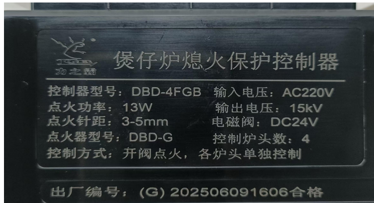
型号 DBD-4FGB 铭牌